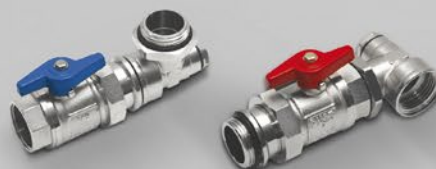
Verteiler-Anschlussset Eck G1"