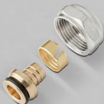
Klemmverschraubungen mit 3/4" Eurokonus von 12 - 20 mm