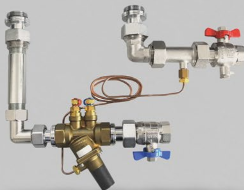
Differenzdruckregler-Anbausset inkl. WMZ-Strecke