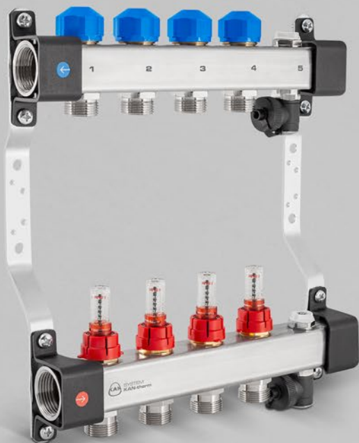
Verteiler mit Durchflussmengenanzeiger, Stellventile und Entlüftungsset - USFT Serie